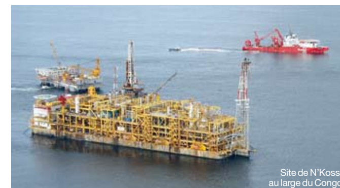
Site de N'Kossa au large du Congo.

Outils de diagnostic précoce servant à évaluer les effets de mélanges polluants sur les organismes vivants dans un milieu donné, les biomarqueurs ont été adaptés en vue de leur application industrielle par Total dès les années 90. La filiale norvégienne Total E&P Norge, au travers de nombreux programmes de recherche, a identifié et optimisé un panel d'outils permettant de mesurer, sur poissons et invertébrés vivant dans l'eau et sur le sédiment, d'éventuels effets associés à la présence d'hydrocarbures. Développés en laboratoire, ces outils ont été testés via des campagnes de suivi environnemental offshore. Les biomarqueurs comptent parmi