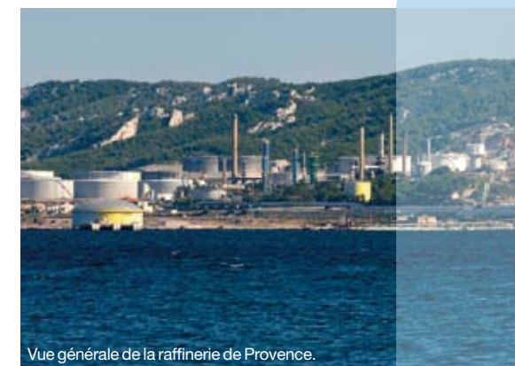
Vue générale de la raffinerie de Provence.

2. Floating Storage and Offloading unit.