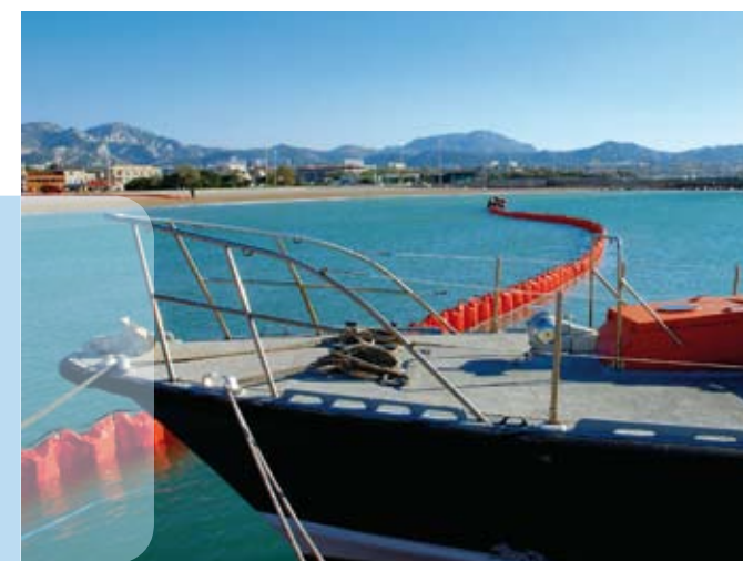
Barrage flottant et bateau de sauvetage lors d'un exercice de sécurité antipollution.

Pour être efficace dans les situations d'urgence, il est essentiel d'une part de vérifier la constante mise à jour des plans de lutte contre la pollution et leur adéquation par rapport à l'environnement du site, d'autre part de former et entraîner les équipes concernées (top management, membres de la cellule de crise, opérationnels, etc.). Total organise régulièrement des exercices grandeur nature de déploiement de matériel et de gestion de crise. Le Groupe participe également régulièrement à des exercices communs avec les autorités concernées (Marine Nationale en France, capitaineries des ports...) en mettant ses équipements à disposition.