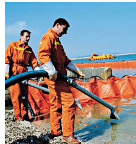
Marins-pompiers du FOST lors d'un exercice.