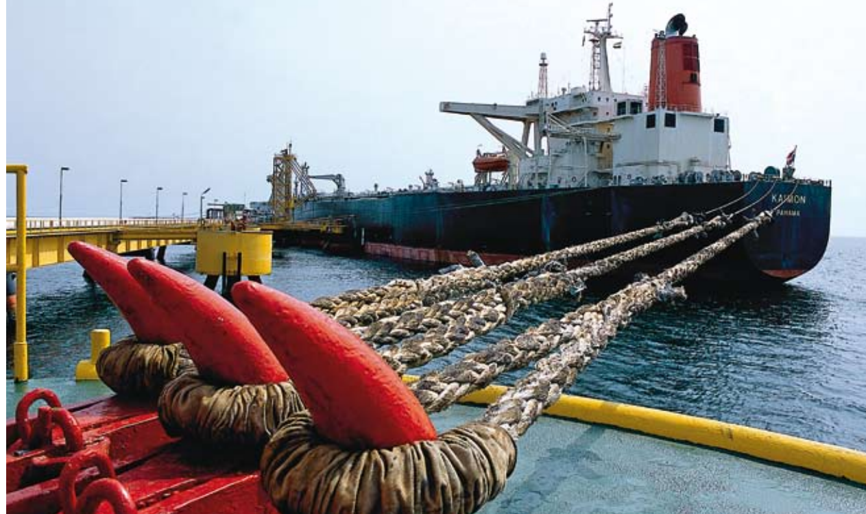
Chargement d'un pétrolier au Gabon.

Par ailleurs, sur les projets de production d'hydrocarbures, les équipes disposent d'outils permettant d'évaluer le développement des fissures et de déployer des actions correctives. Une part importante des pollutions accidentelles vient cependant des opérations d'accostage ou de